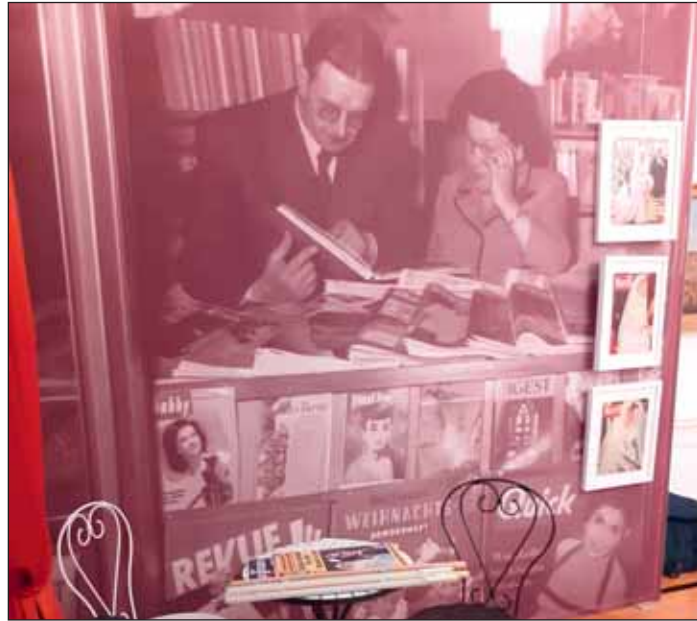
Plakatmotiv Sonderausstellung „Liebe! Beziehungstatus: kompliziert.“.

Der Sommer bietet ein buntes Programm im Schlossmuseum. In der Sonderausstellung „Liebe! Beziehungstatus: kompliziert.“ dreht sich alles um die (Beziehungs-) Geschichten der Braunschweigischen Herzöge