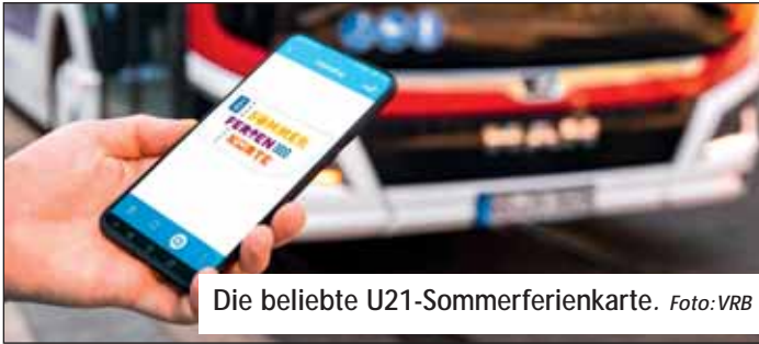
Die beliebte U21-Sommerferienkarte.

Alle jungen Leute bis einschließlich 20 Jahren können vom 6. Juli bis 16. August 2023 mit der U21-Sommerferienkarte der Verkehrsverbund Region Braunschweig (VRB) durch die Region fahren. Das Ticket gilt in allen Bussen, Trams und Nahverkehrszügen im Gebiet des Verkehrsverbundes. Das heißt von Hankensbüttel im Norden bis nach Braunlage im Süden und von Helmstedt im Osten bis nach Hohenhameln im Westen. Das Ticket gilt an allen Wochentagen (Mo. bis So.) rund um die Uhr. Es kostet einmalig nur 20,60 Euro. Die U21-Sommerferienkarte steht in den Handy-Apps: „VRB-Fahrinfos & Tickets“, „Meine BSVG“ und die „WVG-App“ zur Verfügung, sie kann auch beim Buspersonal, an den Fahrkartenautomaten in den Trams und an den Bahnhöfen und in den Vorverkaufs- und Servicestellen der Verkehrsunternehmen (außer bei der Deutschen Bahn) gekauft werden. Weitere Informationen: www.vrb-online.de/u21-sommer .