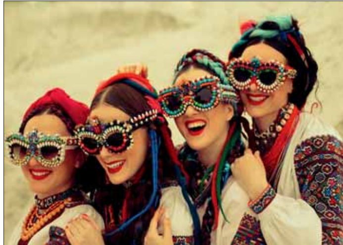
„Yagody“, aus dem westukrainischen Lwiw, von Studentinnen der Theater-Fakultät gegründet, singt am 21. Juni 2023, 20 Uhr, beim Wolfenbütteler KulturSommer charismatische Folkmusik.

19:30 Uhr Rolling Mill Orchestra, Schloss Wolfenbüttel