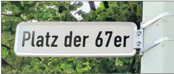
Platz der 67er.

Eintracht und die Stadt ehren die Helden von 1967