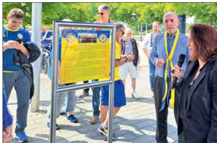
Enthüllung einer Gedenktafel am "Platz der 67er".

ein in einem sicherlich vollen Stadion. Es ist eine Partie, auf die wir uns freuen können", so Eintrachts neuer Trainer Jens Härtel. „Und damit das schwerstmögliche Los gezogen. Saison fängt schon wieder gut an.“ „Was ein Scheiss-Los... gegen die spielen wir eh schon in der Liga und es ist mit das Schwerste, was man kriegen kann.“ - die Schalke Fans wissen um die Wucht des Eintracht Stadions gerade in Pokalspielen. Jetzt liegt es nur noch an der neu formierten Eintracht Mannschaft, schon im ersten Ligaspiel die Fans als 12. Mann zu mobilisieren, dann ist auch ein Weiterkommen im Pokal möglich. Matthias Schumacher