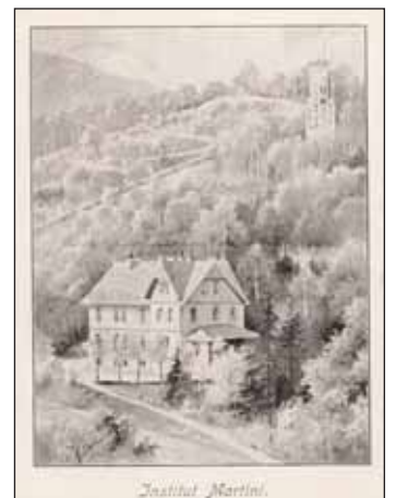
Institut Gnauck-Kühne in Blankenburg.