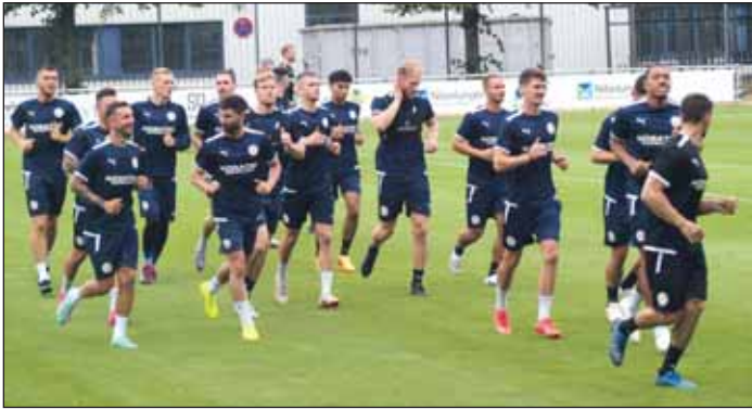
Aufgalopp für eine sorgenfreie Saison.