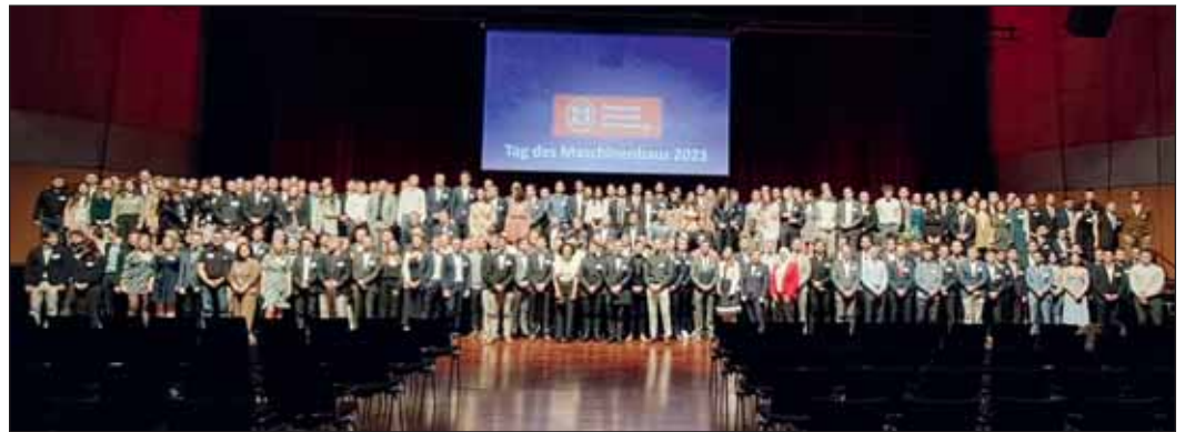
Gruppenbild der AbsolventInnen.