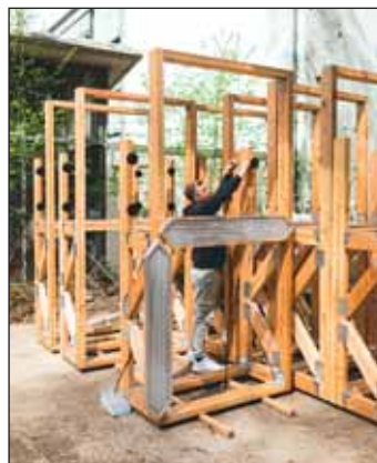
Die ClimateCrisisClock wurde am 15. Juni gestartet.

keit schaffen, mit der wir handeln müssen, um die negativen Auswirkungen des Klimawandels einzudämmen“, sagt die Präsidentin der TU Braunschweig, Angela Ittel. „Wir hoffen, dass die Klima-Uhr Studierende und Mitarbeitende unserer Universität, aber auch die breitere Öffentlichkeit dazu inspiriert, aktiv zu werden und Lösungen zu finden, die eine nachhaltigere Zukunft ermöglichen“. Seit dem 15. Juni leuchten nun die großen, roten Ziffern. Die TU Braunschweig lädt jetzt alle ein, die ClimateCrisisClock persönlich zu besuchen und den Countdown zu beobachten.