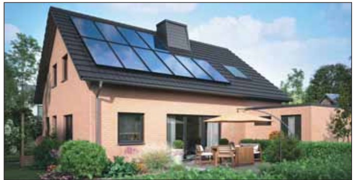
Umweltfreundlich: Hybrid-Heizsysteme.

Mit neuen Richtlinien macht der Gesetzgeber Tempo für die Energiewende im Heizungskeller. Jetzt heißt es für Hausbesitzer, einen kühlen Kopf zu bewahren – und zu handeln. Der Staat hilft mit Zuschüssen, vergünstigten Darlehen und Steuererleichterungen. So macht sich der Umstieg langfristig bezahlt. Wie könnte der Einstieg in den Heizungstausch aussehen?