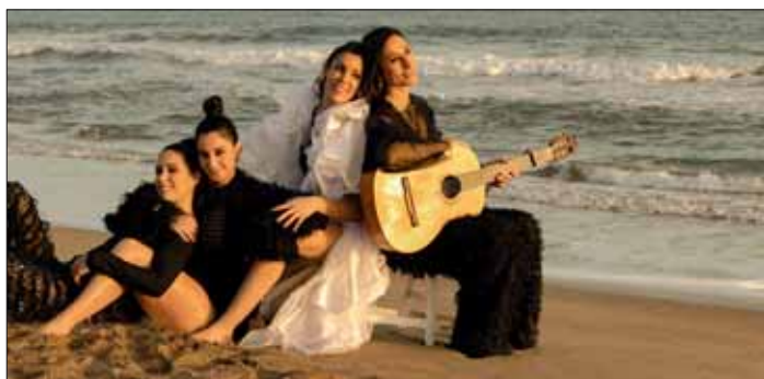
Beim Wolfenbütteler KulturSommer dabei: „Las Migas“, das Flamenco-Quartett aus Barcelona.