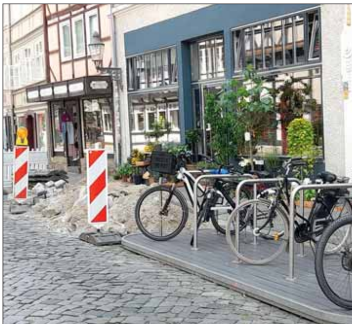
So sieht es im Magniviertel derzeit aus.

stellt und zwei Übergänge über die Straße Ölschlägern sollen besser begehbar gestaltet werden.