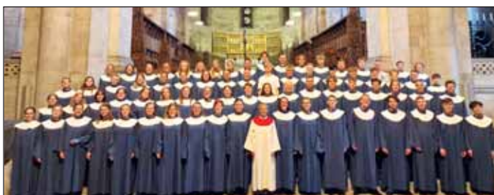
Jugendkantorei der Braunschweiger Domsingschule.