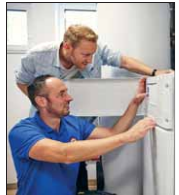
Heizungstausch ist Profiarbeit.

Konkret wird es, wenn Sie Sachverständige für Energieberatung hinzuziehen. Sie prüfen Ihr Haus auf Schwachstellen und helfen bei einer individuellen Lösung für den Wechsel, vom passenden Heizsystem bis zu den Fördermöglichkeiten. Sogar die Beratung wird vom Bund gefördert. Zugelassene Experten in Ihrer Nähe finden Sie über die Deutsche Energieagentur.