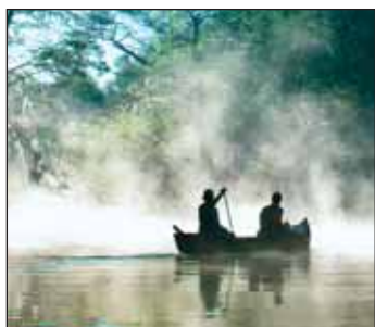
Eins mit der Natur.