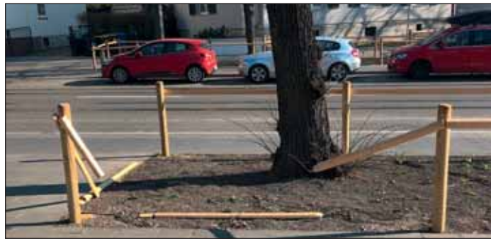
Vandalismus oder Dummheit?

der Stadt Braunschweig sich von so viel sichtbar gewordener Dummheit nicht entmutigen lässt, die inzwischen schön gestalteten öffentlichen Bereiche auch zukünftig mit Neuanpflanzungen von Rasen und bunten Blüten als sichtbarem Ausdruck einer naturverbundenen Bürgerschaft zu gestalten.