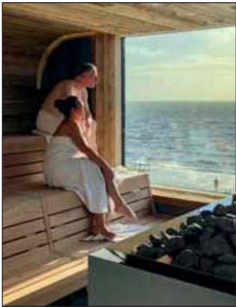
Panoramablick auf das UNESCO-Weltnaturerbe Wattenmeer.