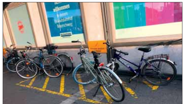
Und immer wieder die Zweiräder...