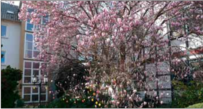
Der Frühling schmückt die Stadt.