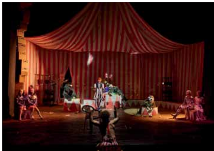
Uraufführung „Wie dem Herrn Mockinpott das Leiden ausgetrieben wird“.