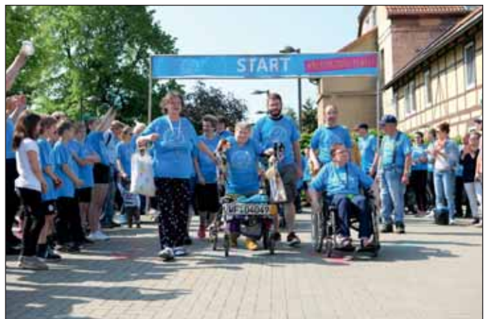
Inklusionslauf „Neuerkerode bewegt“.

Die Registrierung der Teilnehmenden und Ausgabe der Laufshirts erfolgt bereits um 9 Uhr am Tag der Veranstaltung. Ein rechtzeitiges Check-in wird empfohlen, um Verzögerungen beim Start zu vermeiden.