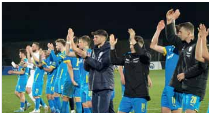
Eintrachts Spieler bedanken sich für die Unterstützung in Dortmund.

Mit drei Heimspielen und der Auswärtspartie in Wiesbaden kann die Braunschweiger Eintracht im April das Signal auf Aufstieg stellen. Ausser den Würzburger Kickers, die noch eine Minichance haben, das Durchreichen von Liga II in den Amateurfussball zu verhindern, ist für die anderen Gegner die Saison so gut wie gelaufen. Allerdings muss die Mannschaft die bisher enttäuschende Heimbilanz mit neun nicht gewonnenen Spielen im Eintracht Stadion aufpolieren und die Gunst der Stunde mit der Kraft von gut gefüllten Zuschauererrängen für sich nutzen. Trainer Schiele warnte aber auch schon zu Recht, dass die kommenden Kontrahenten befreit aufspielen können ohne den Druck des Gewinns.