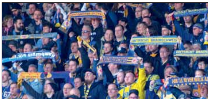
Das Eintracht Stadion darf bis zum Saisonende zur Freude der Fans wieder voll ausgelastet werden.

Festtage im Eintracht Stadion und eine Riesenunterstützung durch das Fanlager in Wiesbaden – jetzt liegt es an der Mannschaft von Trainer Michael Schiele die positive Grundstimmung in Tore und Siege umzumünzen.